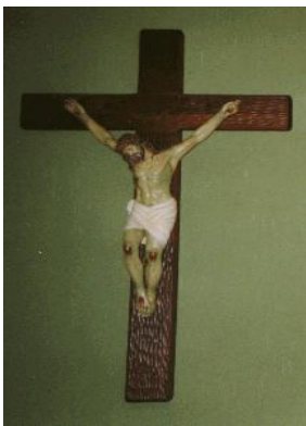
耶穌的十字架在哪裡， 耶穌孝女就在那裡。