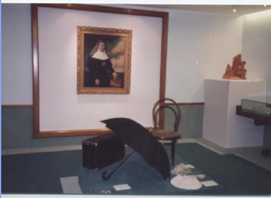
她遠行用的皮箱和傘