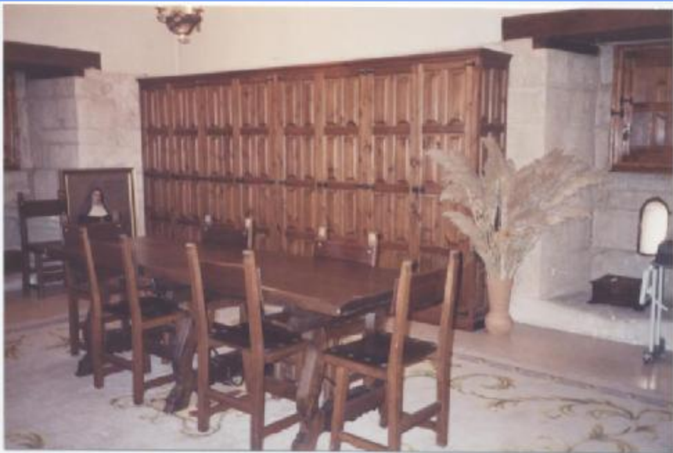
她和修女們的會議室