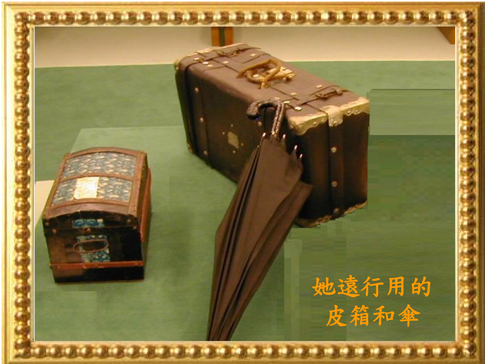
她遠行用的 皮箱和傘